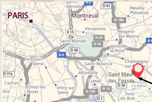
Le Château des Îles

A86 → ROISSY/LILLE → SORTIE BONNEUIL/ST MAUR DES FOSSES → CRETEIL EGLISE (Rue des Mèches - N 186) → ST MAUR (Avenue de Verdun - N 186, jusqu'au Pont de Créteil), après le PONT DE CRETEIL, tourner à DROITE et ensuite à GAUCHE pour longer les QUAIS DE LA MARNE (Quai du Port au Fouarre, Quai de la Pie, Quai de Bonneuil, Promenade des Anglais) → PONT DE CHENNEVIERES → Tout droit le long de la MARNE, QUAI WINSTON CHURCHILL, jusqu'au N°85.